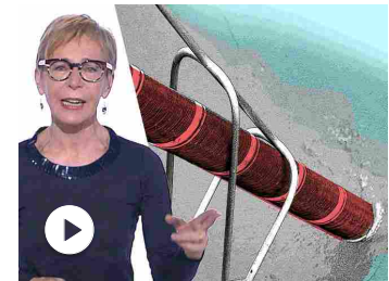
Chi controlla i dati di quasi 8 miliardi di persone? | Milen...