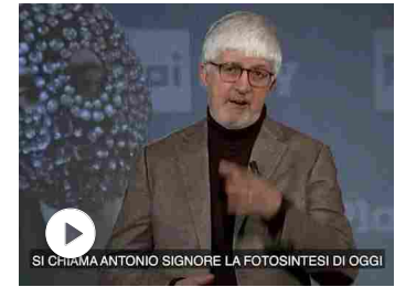
Junior Cally dev'essere escluso da Sanremo? No. Tutti devono...