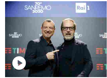
Sanremo 2020, parla il nuovo direttore di RaiUno: «Io un tec...